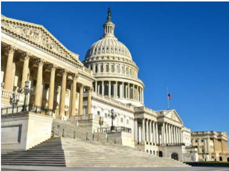
Das Kapitol in Washington (Zusatzausflug)