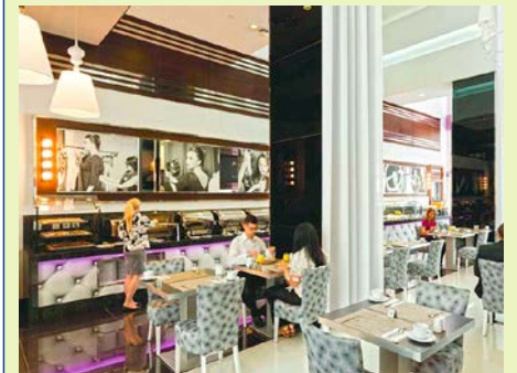
Frühstück in stilvollem Ambiente